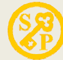
Deutsche Schule Kopenhagen