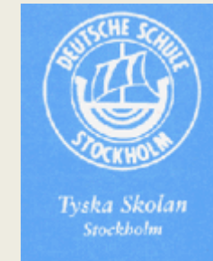
Deutsche Schule Stockholm