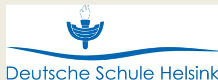
Deutsche Schule Helsinki