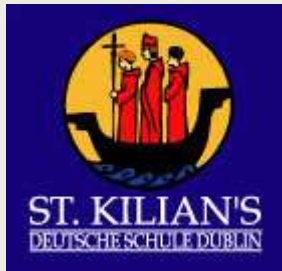
Deutsche Schule Dublin